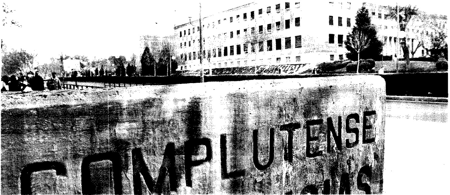
La Universidad Complutense de Madrid no ofertará para el próximo curso, 2008-2009, ningún título adaptado a Europa.