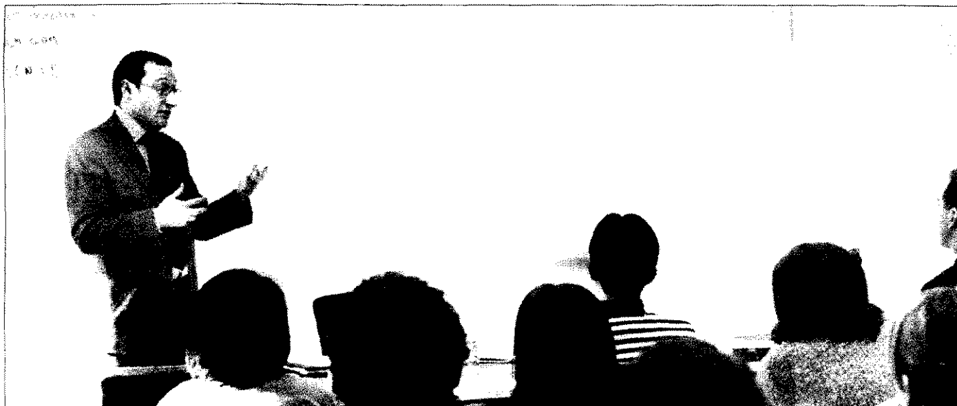
Imagen de un aula de la escuela mientras un profesor de clase.

EAE ► Escuela de Administración de Empresas