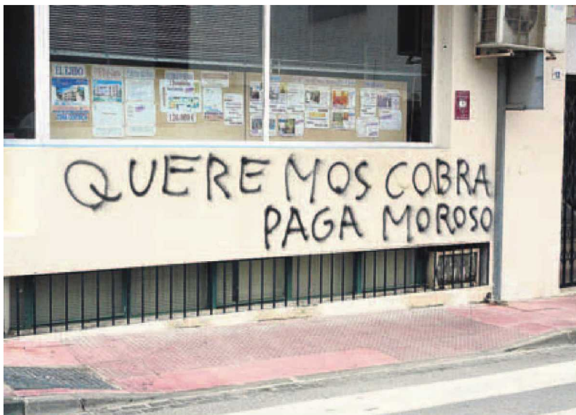
Pintada en la fachada de una inmobiliaria por un problema de impago a los proveedores.