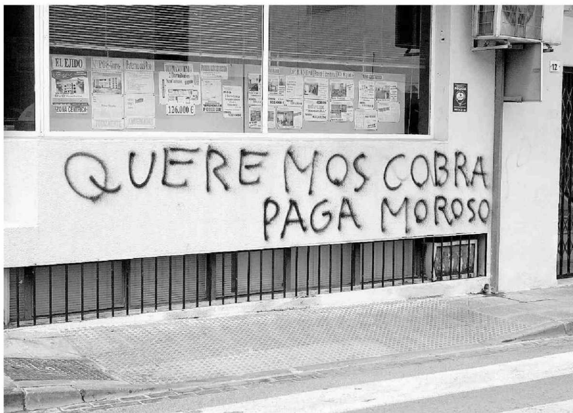
Pintada en la fachada de una inmobiliaria por un problema de impago a los proveedores.