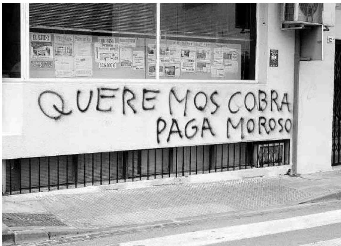
Pintada en la fachada de una inmobiliaria por un problema de impago a los proveedores.

Couceiro, «hay que cambiar el modelo de negocio y convertir las prácticas comerciales en una prioridad para las empresas». Para ello han elaborado, con la colaboración de Intrum Justitia, un decálogo de medidas que insta a las empresas, por ejemplo, a establecer límites asumibles a la concesión de créditos o a revisarlos periódicamente. Una práctica –esta última– prevista en la ley, pero apenas aplicada por el 5% de las empresas, que en su mayoría temen que acogerse a esta cláusula les haga perder la confianza de sus clientes.