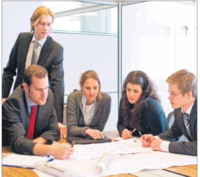
El Centre d'Estudis de Morosologia de l'EAE proposa 12 mesures per millorar la llei antimorositat.

Els sectors de l'alimentació, amb 100 dies de pagament i la construcció, amb 230 dies, són els que menys compleixen amb la llei de lluita contra la morositat. En el context europeu, i segons l'informe, Espanya és un dels primers països al rànquing de demora