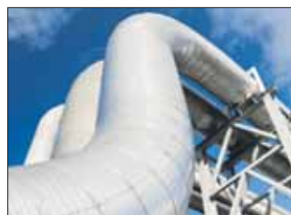
L'atracció de multinacionals és un repte.

Les empreses més grans de Catalunya també se'n ressenten de la crisi i tenen dificultats per accedir a les ajudes econòmiques. Per afrontar millor aquest moment difícil, des d'ACCÍO se'n vol promoure la seva internacionalització. Un altre dels reptes és atraure multinacionals cap a Catalunya, on, a més, cada cop hi ha menys empreses estatals que hi tinguin la seva seu.