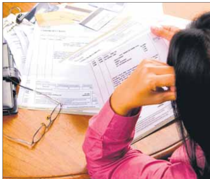
Unes 2.700.000 empreses pateixen problemes de retardament en els pagaments.

■ Només un 5 per cent aplica la llei 3/2004 per combatre la morositat.