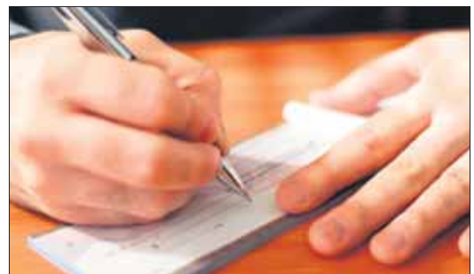
Els xecs sense fons i altres documents canviaris són el malson de molts creditors.

Del que es tracta doncs, és d'aconseguir que la llei es compleixi i faciliti la prevenció de la morositat, donar major seguretat a les transaccions i facilitar el trànsit comercial entre empreses.