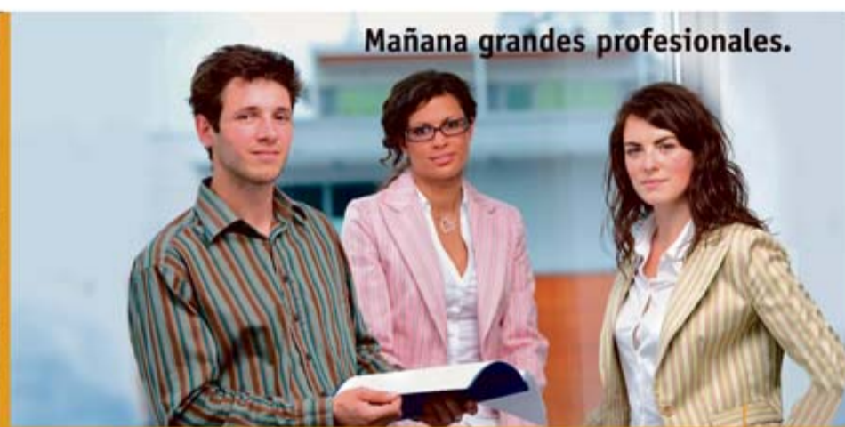
Mañana grandes profesionales.